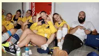
Le nostre ragazze