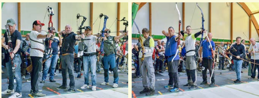
Campionato italiano di Tiro con l'arco Indoor

CAMPIONATO ITALIANO Nel mese di novembre, la Polisportiva ha avuto l'onore di ospitare il primo campionato italiano della Fidasc di Tiro con l'arco Indoor. Sì, perché oltre 150 atleti da tutta Italia si sono dati battaglia a suon di frecce con lo sfondo della nostra tensostruttura. Adibito ad hoc per l'occasione con una serie di sagome, lo spazio polivalente ha ospitato l'evento indetto dalla Federazione e curato dall'Asd Arcieri Lupi del Nord e Arcieri delle Groane. Nella disciplina in questione mai prima