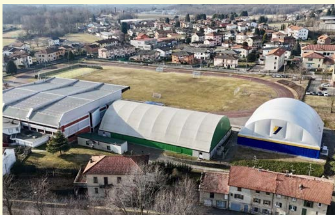
Panoramica del centro sportivo